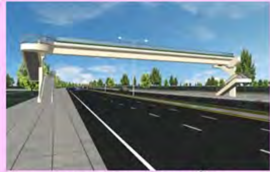
การออกแบบสะพานลอยคนข้าม

ผู้ว่าจ้าง : สำนักก่อสร้างสะพาน กรมทางหลวงชนบท กระทรวงคมนาคม ที่ปรึกษา : บริษัท เอพีจิลอน จำกัด / บริษัท แพลนโปร จำกัด / บริษัท ดีเคดี คอนซัลแตนท์ จำกัด / บริษัท ยูไนเต็ด แอนนาลิสต์ แอนด์ เอ็นจิเนียริง คอนซัลแตนท์ จำกัด สัญญาที่ปรึกษา : สกส. ๒๓/๒๕๕๙ ลงวันที่ ๓๑ มีนาคม พ.ศ. ๒๕๕๙ วงเงินค่าจ้างที่ปรึกษา : ๕๕,๐๐๐,๐๐๐.๐๐ บาท วันเริ่มต้นสัญญา : ๑ มิถุนายน พ.ศ. ๒๕๕๙ วันสิ้นสุดสัญญา : ๒๓ กันยายน พ.ศ. ๒๕๖๐ ระยะเวลาดำเนินงาน : ๔๘๐ วัน ความก้าวหน้าของโครงการ : ๘๙.๕๒ % แผนงานที่วางไว้สะสมถึงเดือนนี้ : ๘๙.๕๒ % ผลงานสะสมเร็วกว่าแผนงานสะสม : -