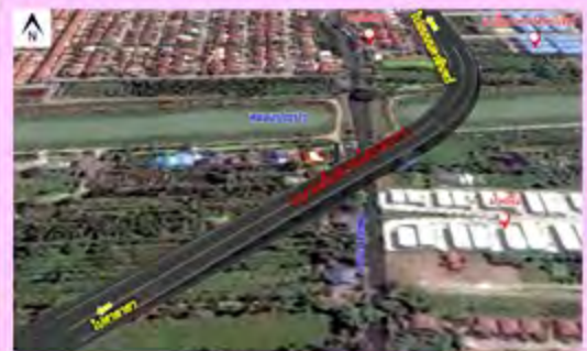
การออกแบบสะพานข้ามคลองประปา