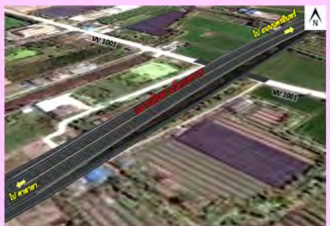
การออกแบบสะพานข้ามทางหลวงชนบท นบ.๑๐๑