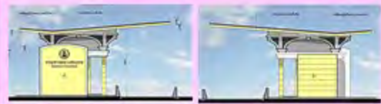
การออกแบบด้านควบคุมน้ำหนักยานพาหนะ